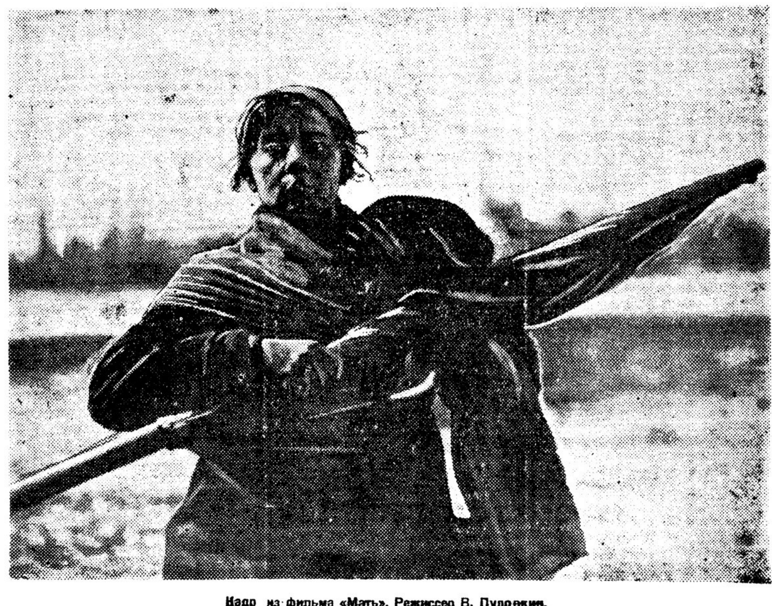
Издр из фильма «Мать». Режиссер В. Пудовкин.