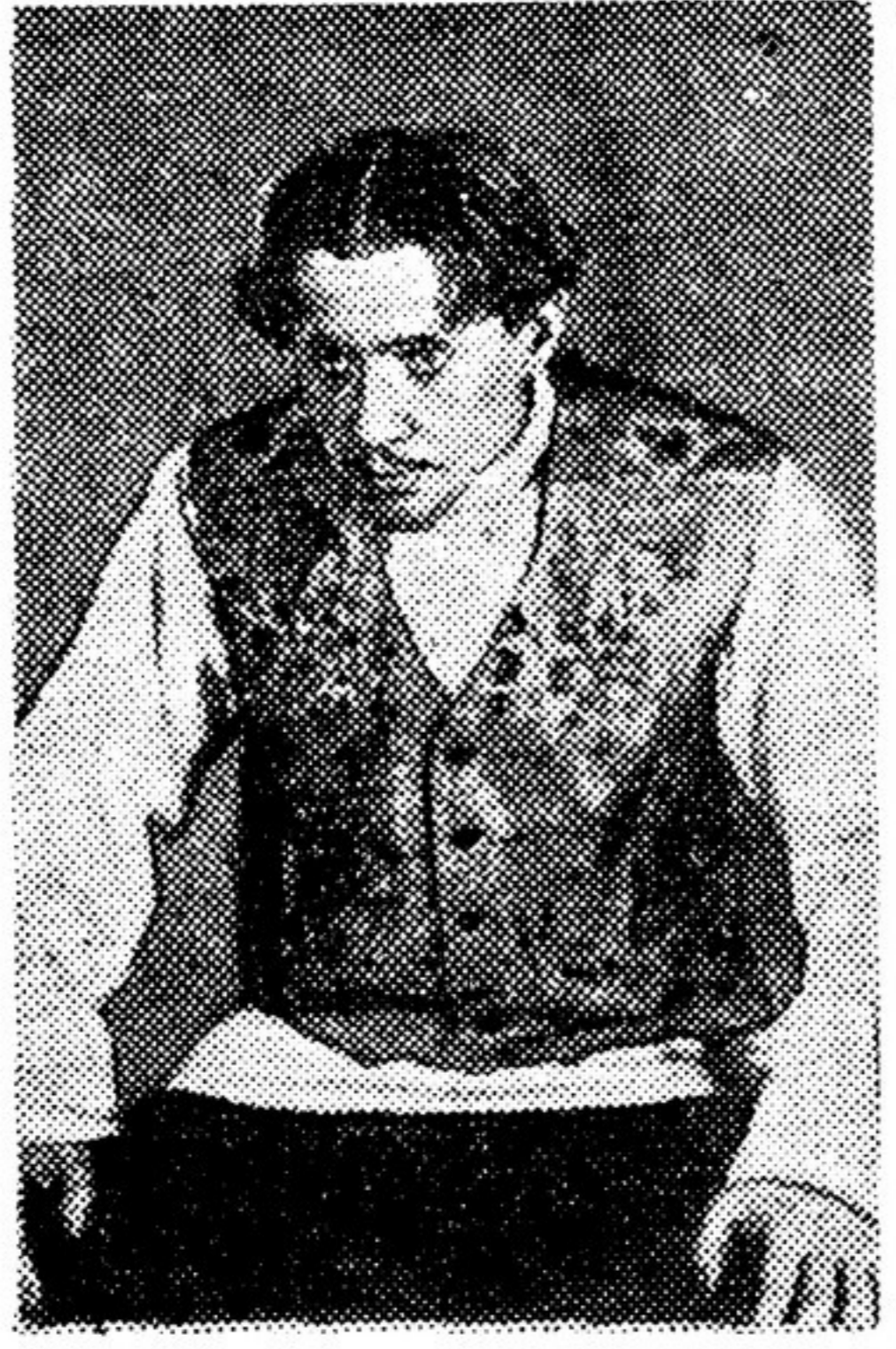
Тихон — арт. Добронравов.

Несколько человек примеривали одежды сумками, их же и в мотках других — художественных принадлежностей. Кой кого отпраздники в Ленинград для осмотра его живописных сокровищ. Самые способные